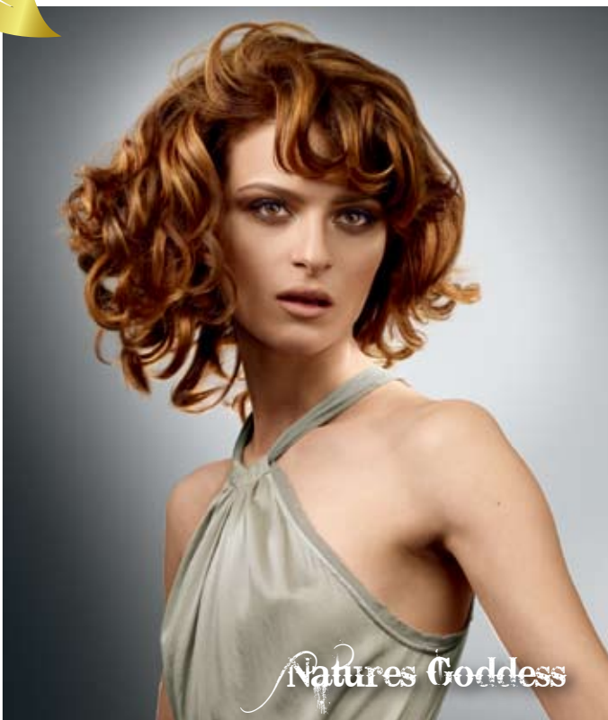
自然絕色 迷醉 · 魅惑