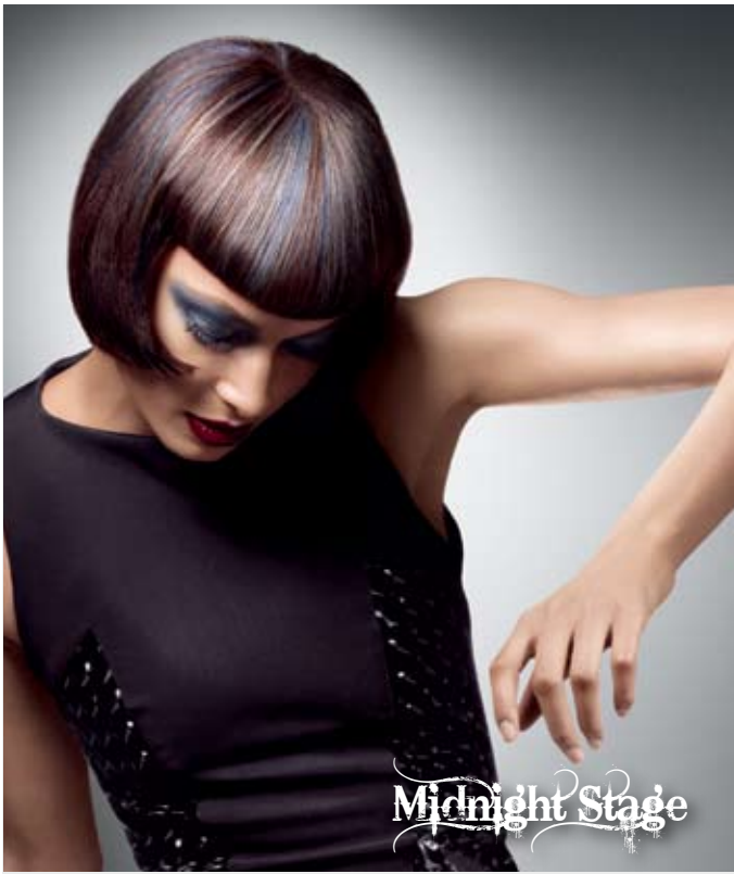
午夜夢迴 纏繞 · 多樣